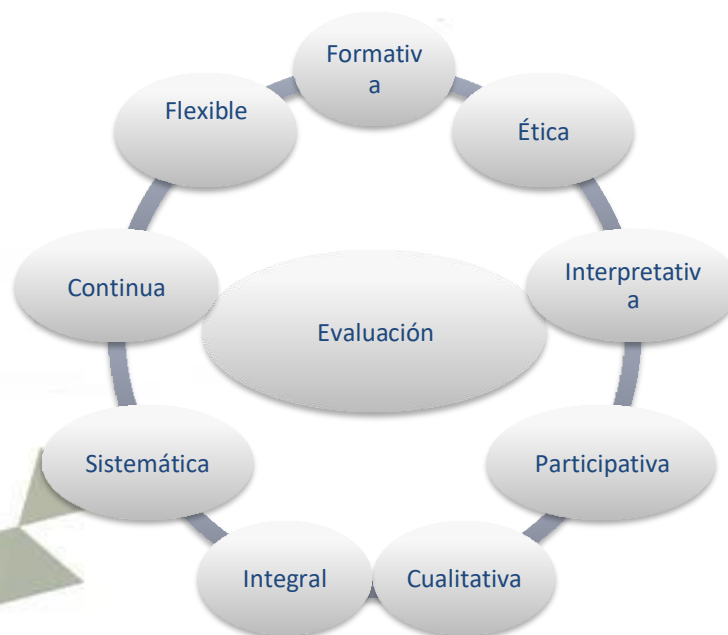
Ilustración 1. Características de la evaluación.