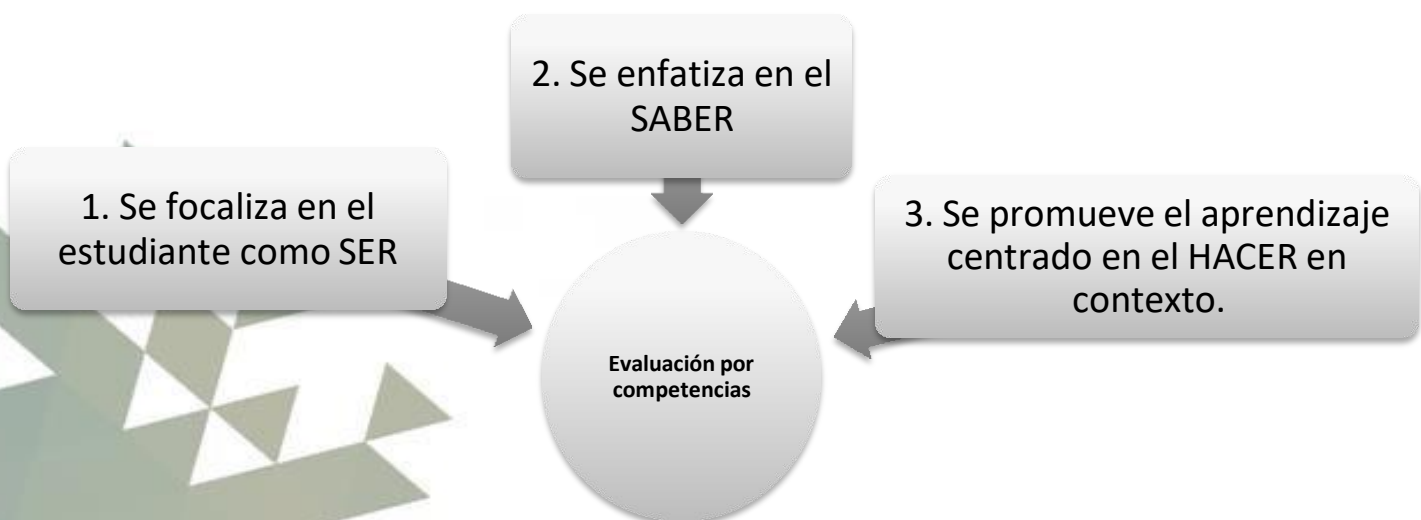
Ilustración 2. Evaluación por competencias.

Las competencias enmarcadas desde la perspectiva de Lozano (2013), se entienden como la capacidad de desempeñarse profesionalmente en una ocupación, por ello en la ENSQ la formación como normalista, se enfoca hacia la adquisición de competencias básicas, personales y profesionales, entre otras, estas competencias se relacionan con el HACER, demostrado en las acciones, actos y productos que cada estudiante demuestra y da a conocer a su docente con el fin de observar su progreso en el aprendizaje para la vida. La Ilustración 2. Evaluación por competencias, refleja las competencias evaluadas en la ENSQ.