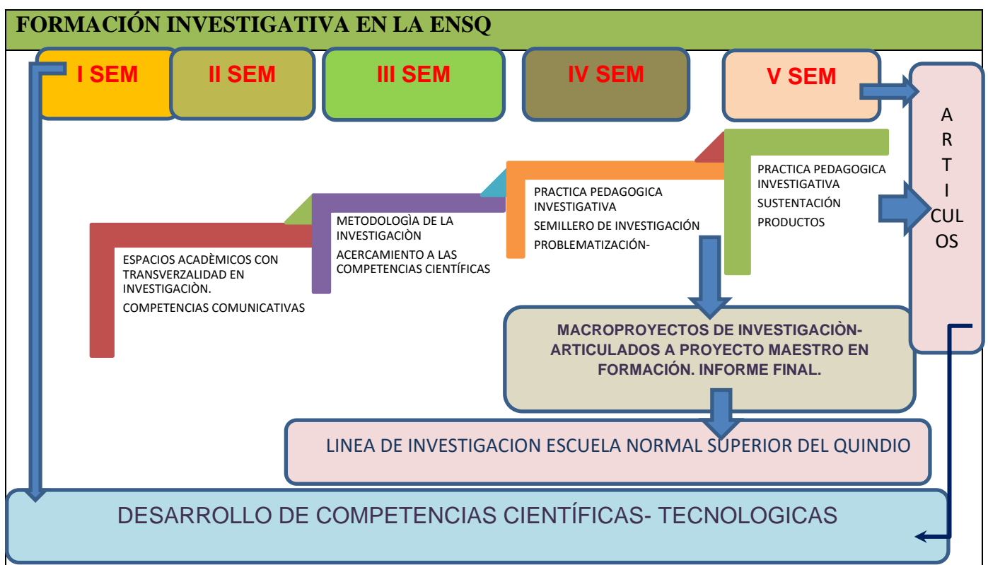
Relación de espacios académicos y semestres que contribuyen a la investigación formativa