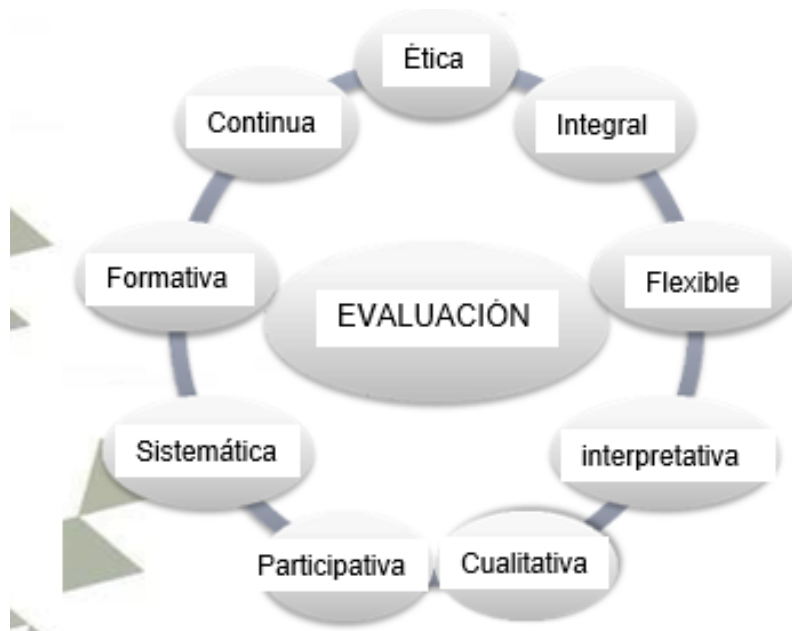
Ilustración 1. Características de la evaluación.